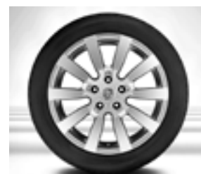
Jante « Cayenne SportDesign II » 20 pouces