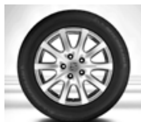
Jante « Cayenne » 18 pouces