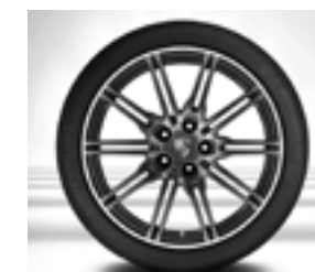
Jante « Cayenne SportEdition » 21 pouces peinte