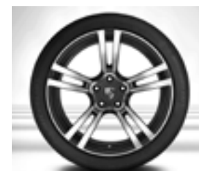
Jante « 911 Turbo II » 21 pouces