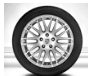
Jante « RS Spyder Design » 20 pouces