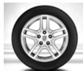
Jante « Cayenne Turbo » 19 pouces