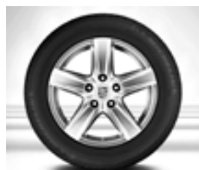
Jante « Cayenne S III » 18 pouces